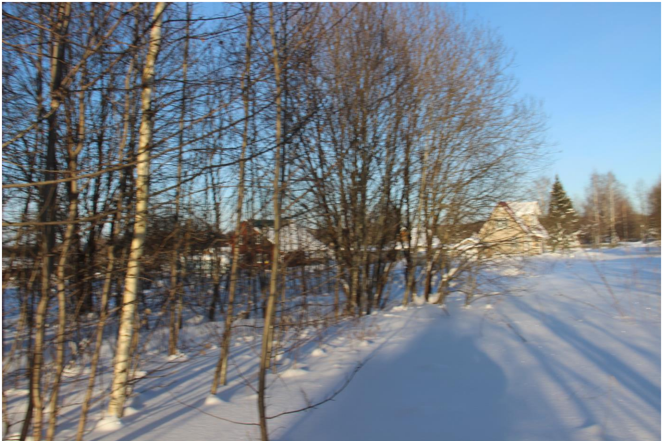
Схематический чертёж земельного участка с кадастровым номером 50:06:0040310:783