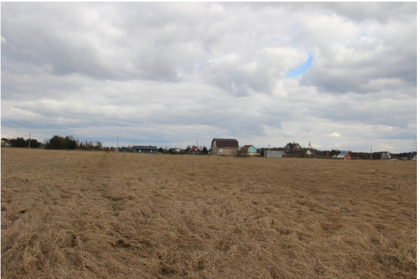
Схематический чертёж земельного участка с кадастровым номером 50:06:0110602:1563