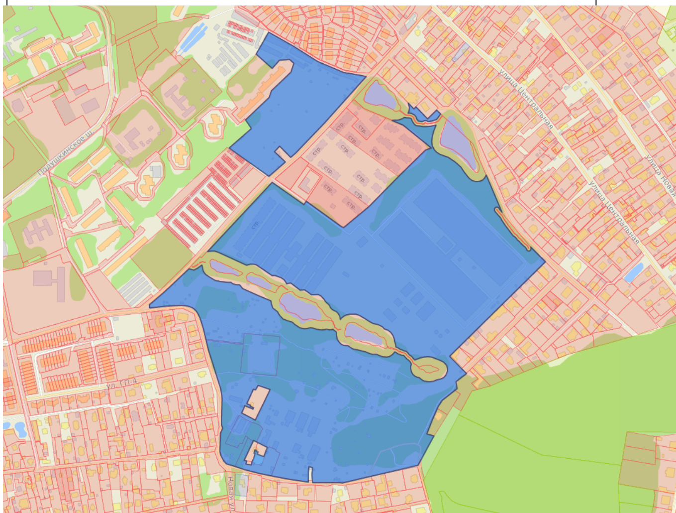
Граница территории комплексного развития

2. Схема расположения границ развиваемой территории на публичной кадастровой карте